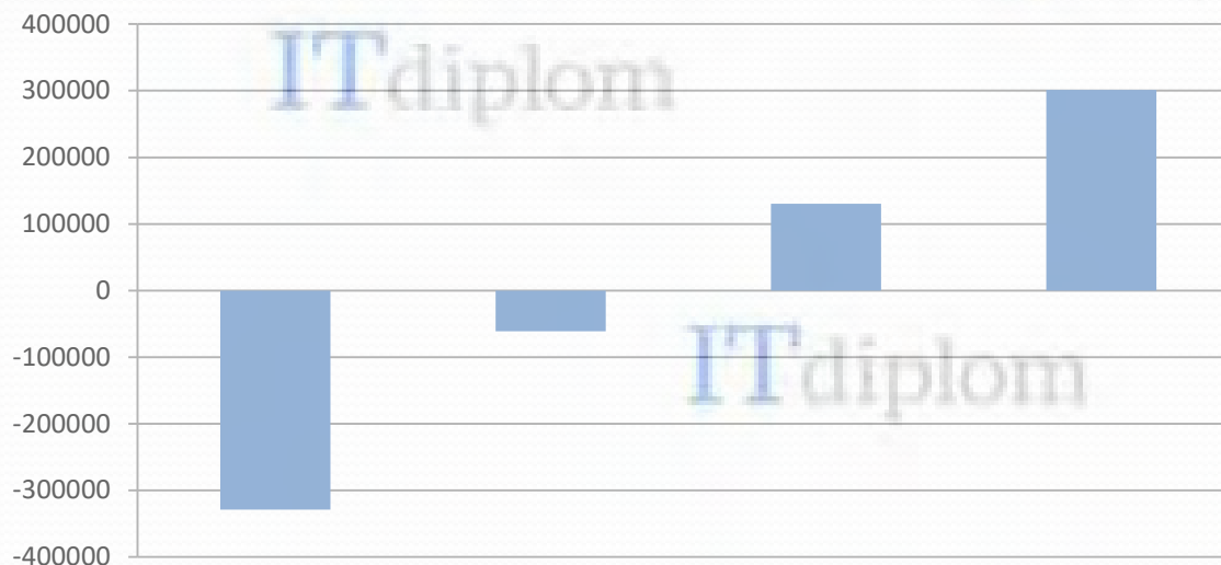
Диаграмма формирования чистой дисконтированной стоимости

ЧДС составляет 301301,95руб. > 0 , срок окупаемости составляет 1 год и 4 месяца, можно сделать вывод об эффективности разработанной АИС администрирования и управления закупками салона красоты «Клеопатра».